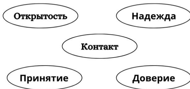
Рис. 2. Основные актуальные способности, развивающиеся в стационарной групповой психотерапии и группах психологической поддержки

Был опыт, когда пациенты, устанавливающие близкий доверительный контакт на групповой психотерапии, продолжали поддерживать друг друга вне стен больницы, обмениваясь личными контактами и помогая решать возникающие социальные проблемы.